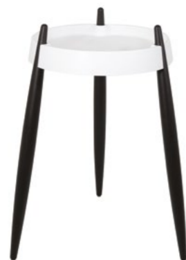
ZLS0102 Bianco - Frassino nero White - Black wood