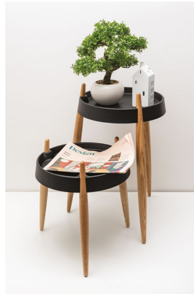
Liolà table (ZLS0005), Liolà table (ZLS0005), Liolà table (ZLS0004), Liolà high table (ZLS0104), Liolà table (ZLS0002)