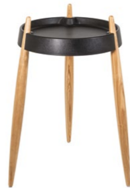
ZLS0104 Nero - Frassino naturale Black - Natural wood