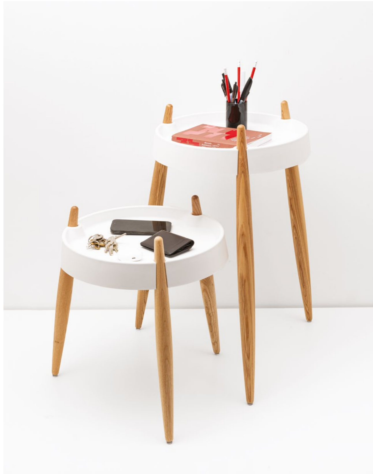
Liolà table (ZLS0001), Liolà high table (ZLS0101)