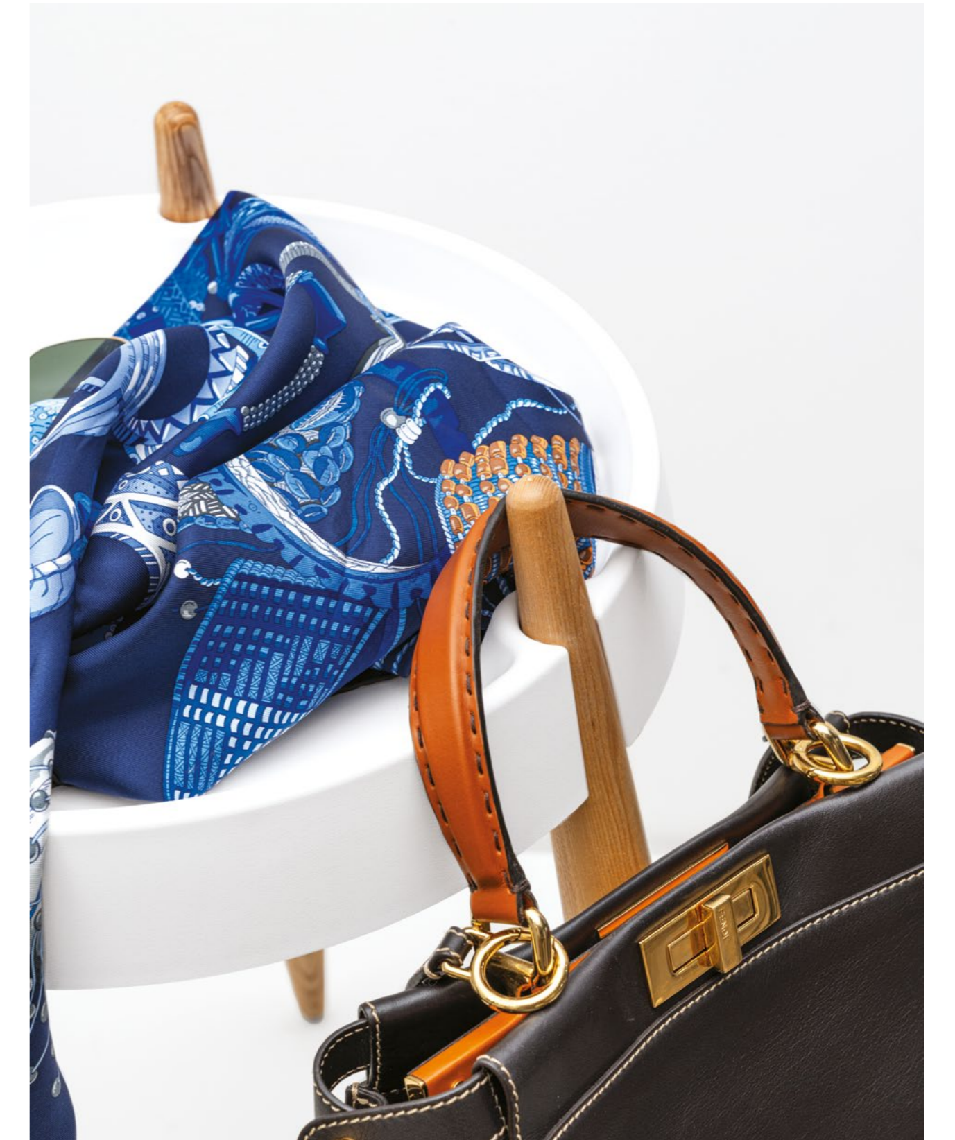
Liolà high table (ZLS0101)