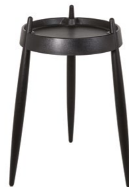
ZLS0105 Nero - Frassino nero Black - Black wood