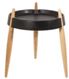
ZLS0004 Nero - Frassino naturale Black - Natural wood