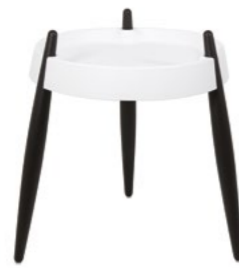
ZLS0002 Bianco - Frassino nero White - Black wood