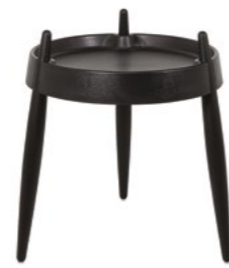
ZLS0005 Nero - Frassino nero Black - Black wood