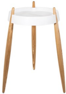
ZLS0101 Bianco - Frassino naturale White - Natural wood