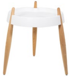
ZLS0001 Bianco - Frassino naturale White - Natural wood