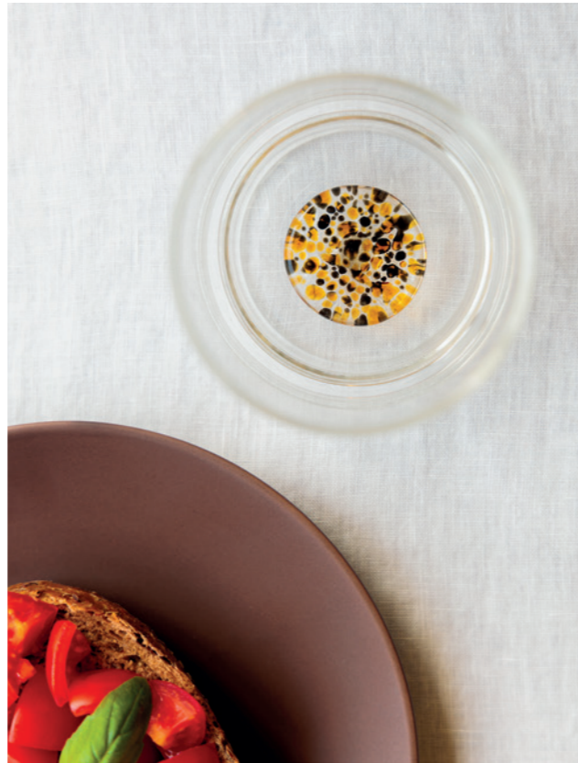
Bilia Candy (BAY0111), Funnel (FNL1218), Teca Terrazzo (TE00122)