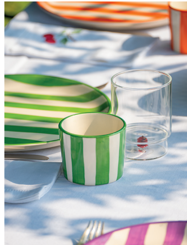
Teca Mare (TE00106 + TE00102), Maestro (MA00620 + MA00520), No Bilia + Lido (NBA0101 + RIM0302)